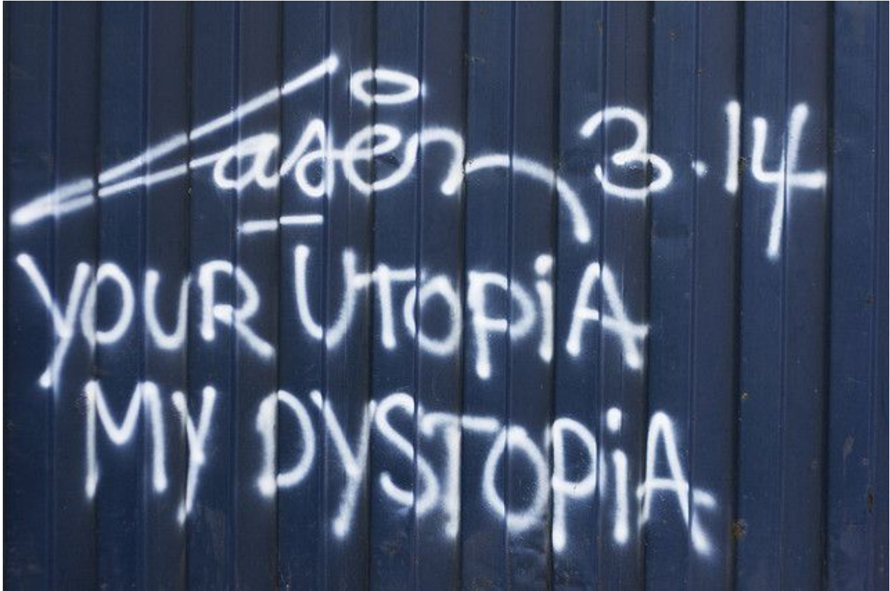
Laser 3.14 Utopa Distopia