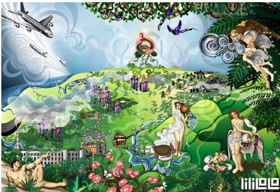
Utopia-Formosa-Taoyuan Leeloosu is licensed under CC BY-NC 2.0

El recientemente fallecido Erik Olin Wright popularizó el término utopías reales para referirse a las alternativas socioeconómicas al capitalismo entre las que prima su apuesta por la viabilidad por encima de su perfección teórica: «Lo que necesitamos son “utopías reales”», esto es, ideales utópicos fundados en las potencialidades reales de la humanidad, destinos utópicos que tengan paradas intermedias accesibles, planes utópicos para instituciones que puedan informar nuestras tareas prácticas de navegar en un mundo de condiciones imperfectas de cambio social” .