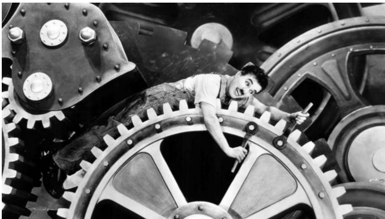
Charles Chaplin. Tiempos Modernos.