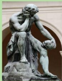
Demócrito meditando. Escultura de Leon Alexandre Delhomme

15, 22 y 29 octubre de 2024 Vía Zoom 18:00 a 20:30