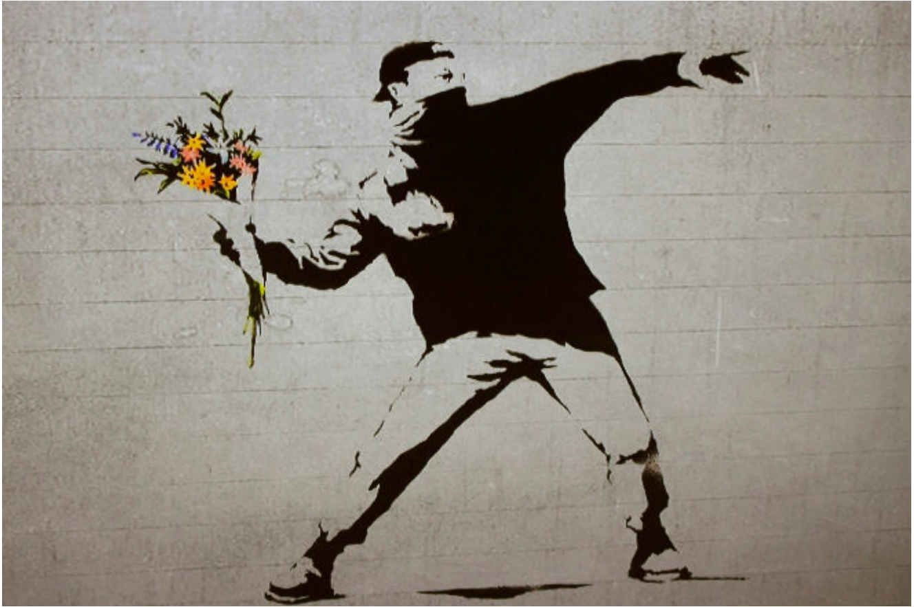
Banksy: arrojando un ramo de flores