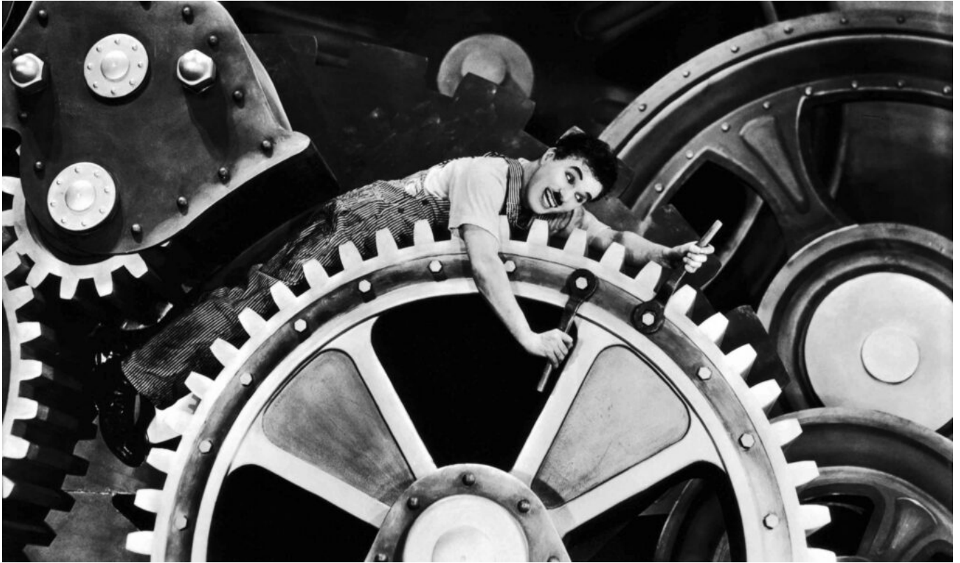
Tiempos modernos. Hipertextual