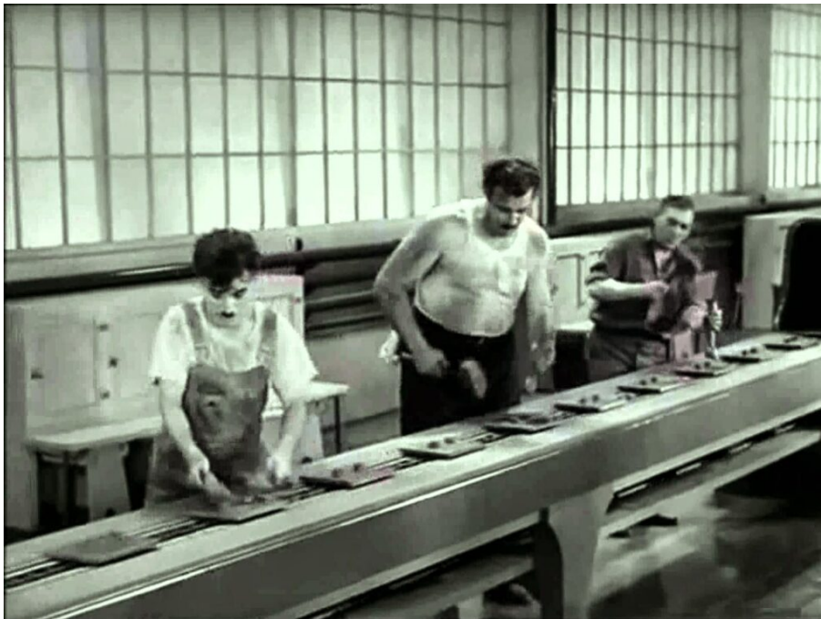
Tiempos modernos. https://www.socialeseimagen.com/2014/12/

medio para obtener un mayor beneficio, en relación con la mejora productiva de cada trabajador. Esta idea da lugar a problemas éticos serios. Por ejemplo, para Kant, lo importante es ser digno de felicidad, y se debe obrar “de tal modo que uses la humanidad, tanto en tu persona como en la persona de cualquier otro, siempre como un fin al mismo tiempo y nunca solamente como un medio” (Kant, 1785). Intentar crear una suerte de felicidad para conseguir trabajadores más motivados sería, en este sentido, un modelo éticamente cuestionable. Aunque dicha felicidad fuera genuina, el pensamiento deontológico kantiano llegaría a la raíz de la cuestión, rechazando las consecuencias.