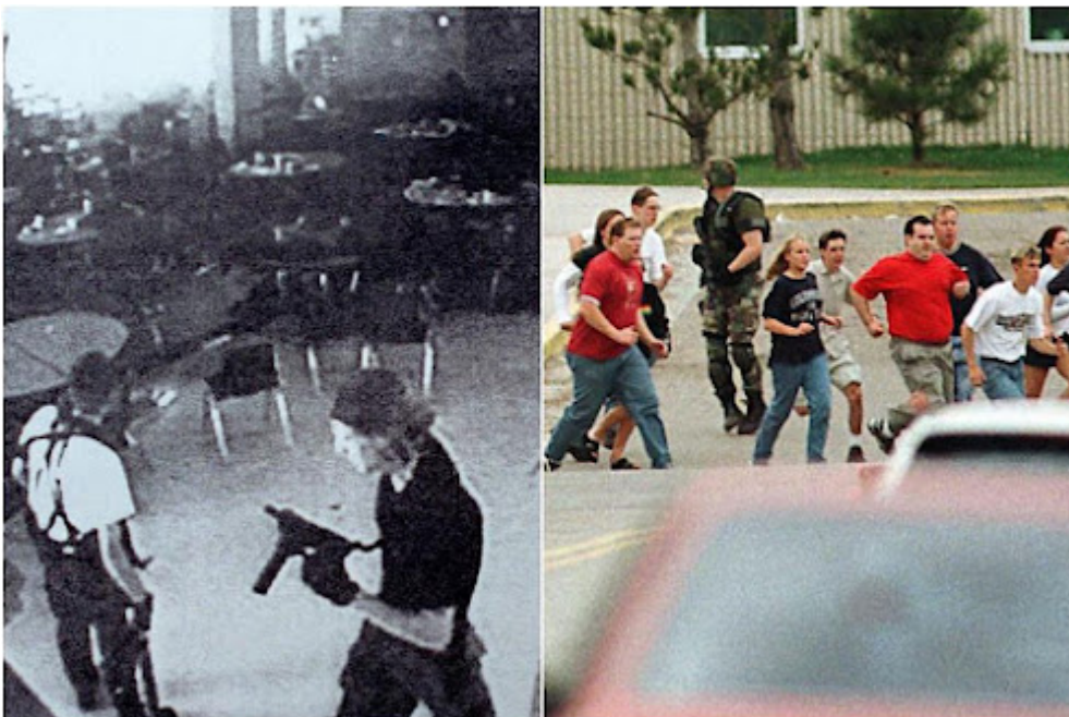
Imágenes del ataque en la escuela Columbine (1999) y en Virginia Tech (2007)

La necesidad criminógena de realizar el ataque podemos asociarla a los deseos de venganza, a la motivación de “hacer justicia”, legítima según el atacante y resolutiva, inevitable. La venganza es un sentimiento que está detrás de muchos actos violentos graves. En este caso se informa de la historia de abusos y malos tratos que pasó el agresor en la escuela (si bien no la misma en que realizó el ataque), también el ostracismo y el aislamiento social que sufrió en su vida escolar y probablemente comunitaria. Esta experiencia - común en el 63% de los autores de matanzas escolares - suele tener un peso específico elevado en estos delitos en los USA. También se añaden las necesidades afectivas no atendidas por parte de los padres ausentes en el desarrollo del adolescente violento. Este factor de riesgo - la falta de una educación parental y familiar eficaz - es muy común en adolescentes violentos.