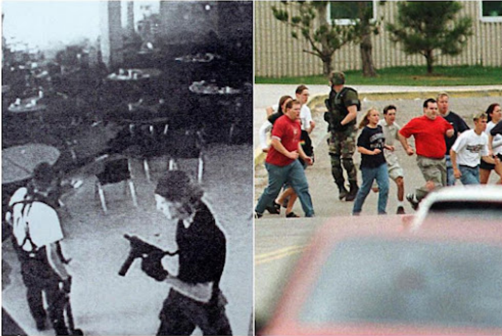
Imágenes del ataque en la escuela Columbine (1999) y en Virginia Tech (2007)