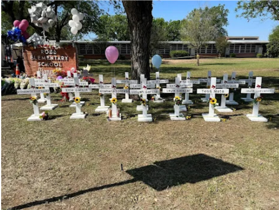
Escuela donde se realizó el ataque en Uvalde, Texas.

Las armas las disparan las personas y lo hacen por algo, algo que suelen tener en su mente y que los lleva a actuar de ese modo.