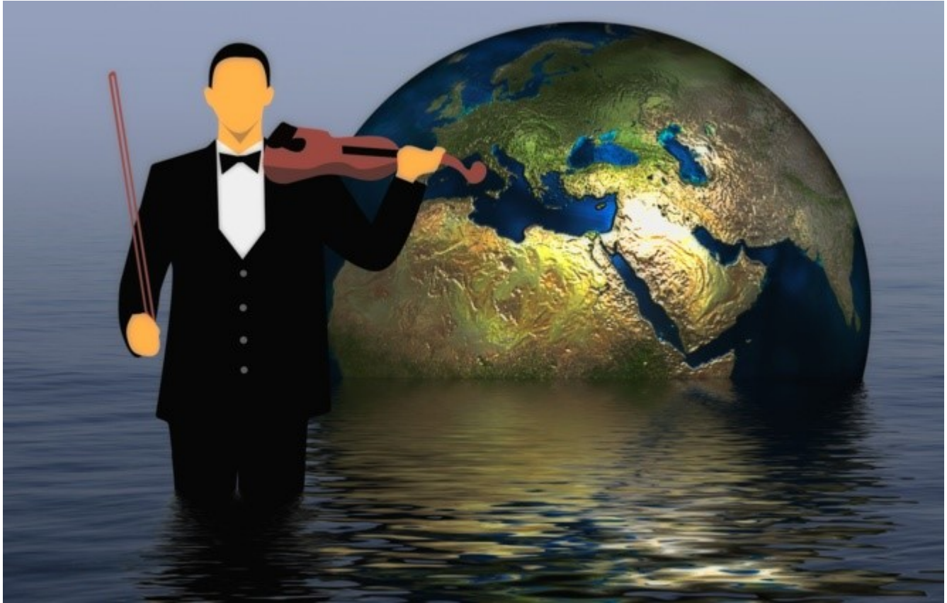
La Tierra se hunde