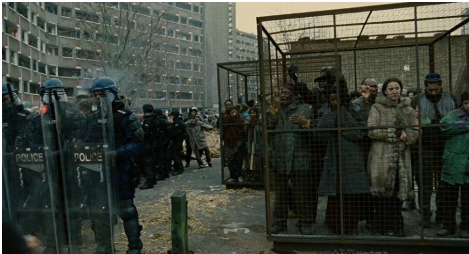
Hijos de los Hombres

La lucha que ahora se perfila en el horizonte, es la de masas ingentes urbanas, en busca desesperada de medios de subsistencia que es dudoso que vayan a encontrar en ningún sitio. Será una lucha por la supervivencia en una selva que no tendrá árboles, una lucha por lo imposible. Y este escrito solo es un pequeño apunte para los que primero intuyeron que esto se iba a dar, más pronto que tarde[3] (Prieto, pp. 39-40)