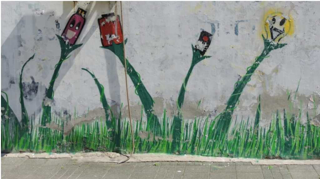
Grafiti urbano.

Cuando consideramos los retos a los que nos enfrentamos como humanidad solemos pensar en cómo formar a los niños y niñas para que puedan adaptarse a ese mundo. Pero, ¿por qué quedarse ahí? ¿Por qué aspirar tan sólo a sobrevivir a estos cambios en lugar de empoderarlos para que lideren un mundo con valores?