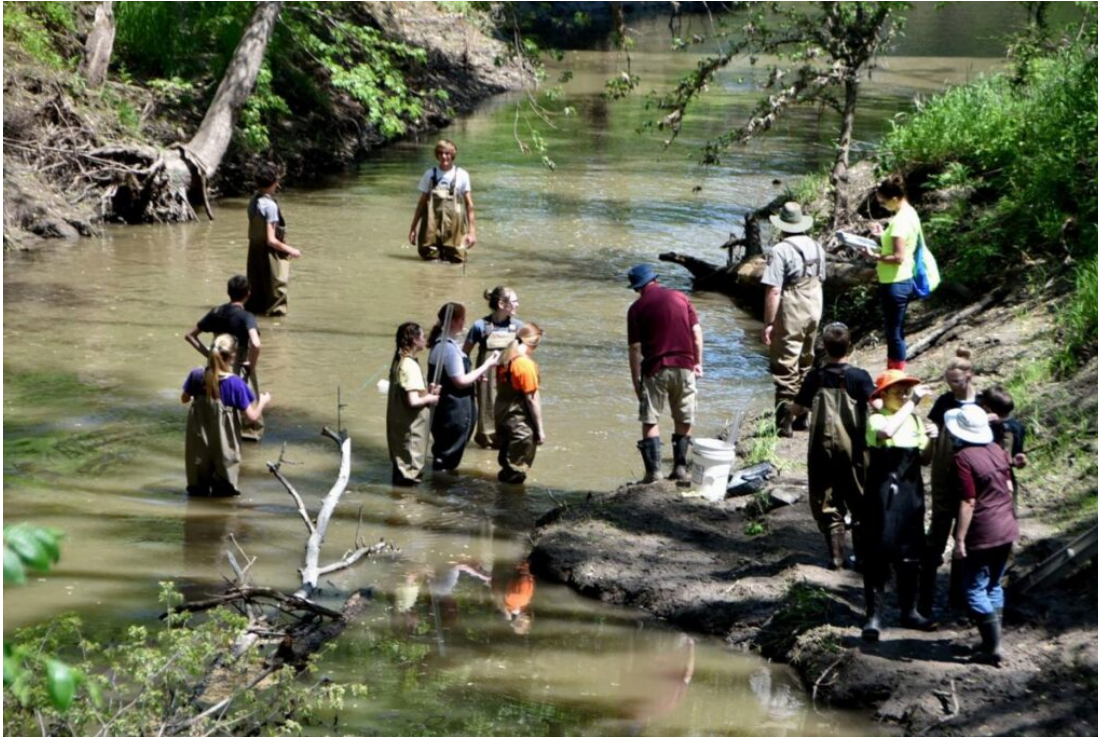
Beatrice Daily Sun. Students spend day water testing at Homestestun