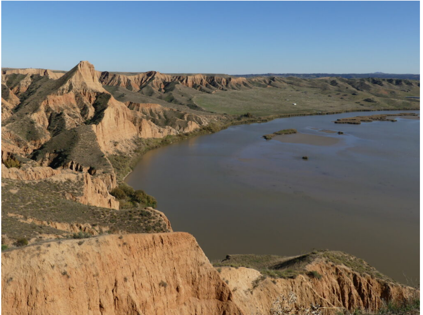
Barranco del Burujón. Toledo.