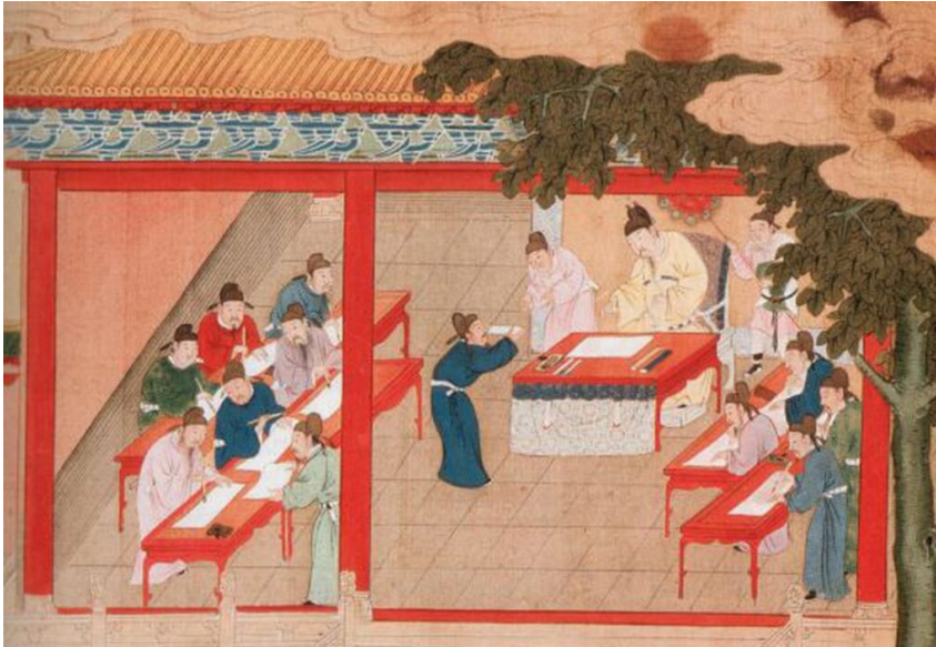
Pintura de la época de la dinastía Song (960-1279) que representa un examen imperial.

profesor de filosofía política, quien eleva tres denuncias que quiero destacar: