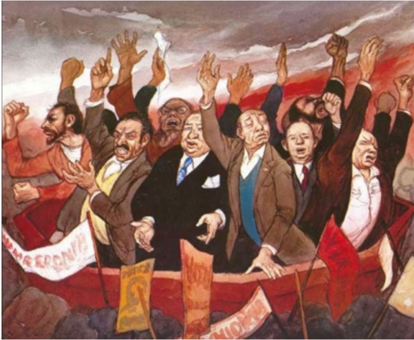
El fracaso de las élites. Lampadia

En este ensayo se denuncia el precio que supone la competitividad sin cuartel que existe por lograr una plaza en las universidades de mayor prestigio en los USA. Los jóvenes que compiten salen heridos del proceso (la tasa de suicidios ha aumentado un 36% entre 2000 y 2017), y, también, se erradica la función educativa de la universidad . Se propone, como antídoto, una estrategia basada en establecer umbrales mínimos de admisión universitaria, que lograrían superar muchos más candidatos que en la actualidad, y sortear seguidamente las plazas disponibles entre quienes hayan alcanzado esos valores ( el mérito como un umbral en lugar de como un ideal a maximizar ). Por supuesto, también habría que esforzarse para que el éxito en la vida no fuese tan dependiente de poseer un título universitario, algo que denunció hace tiempo Charles Murray en ' Real education ', sin que tuviera ninguna resonancia social a pesar de que las líneas maestras de esa publicación se hubieran delineado en tres artículos suyos publicados en el 'Wall Street Journal' en 2007.