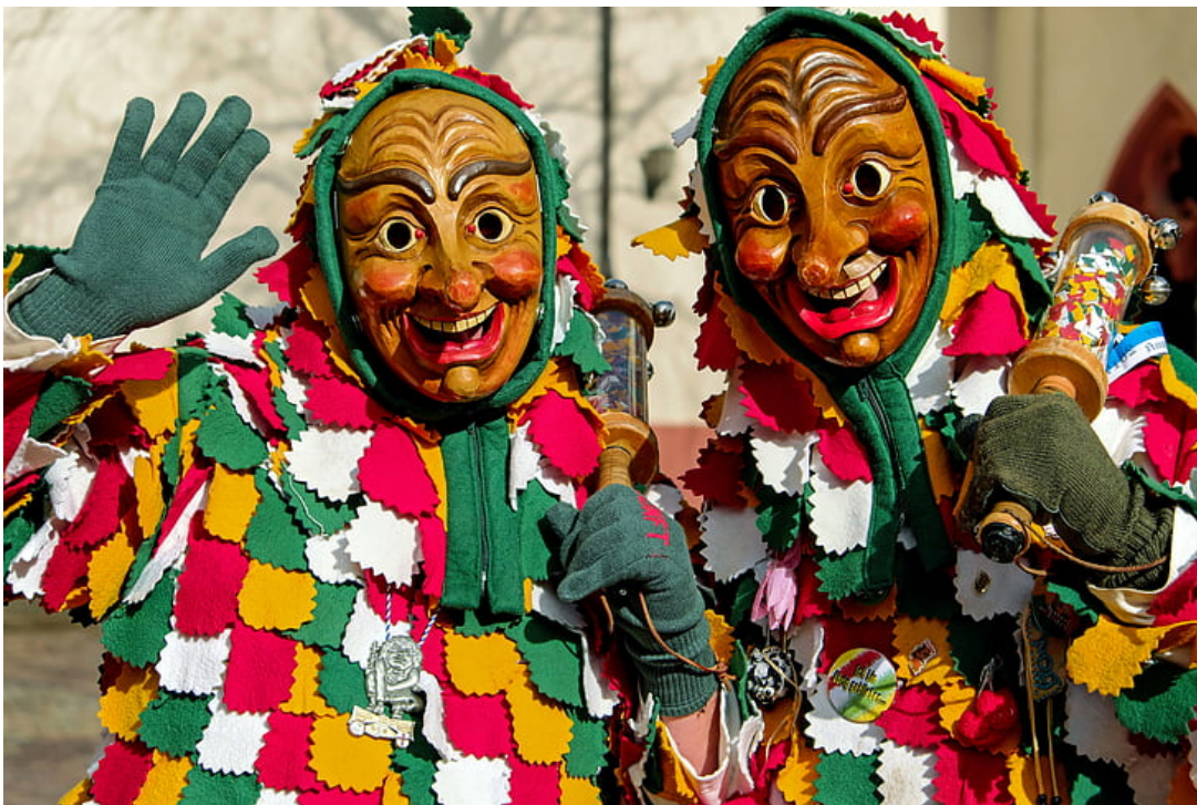
Carnaval Suabo. Máscaras de madera.

La sesión tendrá lugar el miércoles día 24/06/2020 de 17:30 a 19:00. Debido a las restricciones todavía vigentes, la sesión se celebrará en la plataforma Zoom.