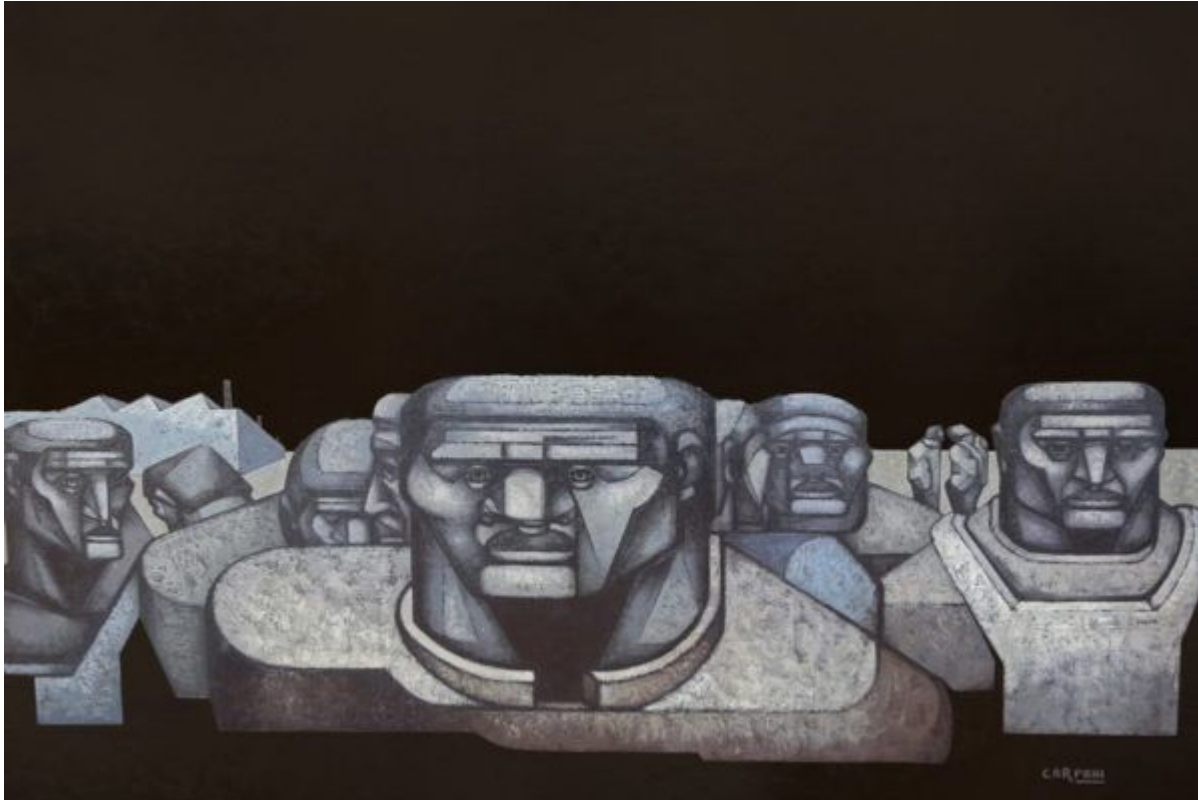
Ricardo Carpani Los que esperan Museo Rallie Marbella

En la búsqueda de posibles soluciones para afrontar estas crisis globales y existenciales están trabajando muchas instituciones internacionales y actores sociales dedicados expresamente a evaluar las posibles crisis que pueden amenazar a la humanidad y la manera de afrontarlas (Torres, 2017). Quizá haya adquirido una importancia preferente la relacionada con el cambio climático y la degradación de la biodiversidad, y también la erradicación de la pobreza y la disminución de la desigualdad, pero son muchos más los escenarios posibles, como decíamos más arriba.